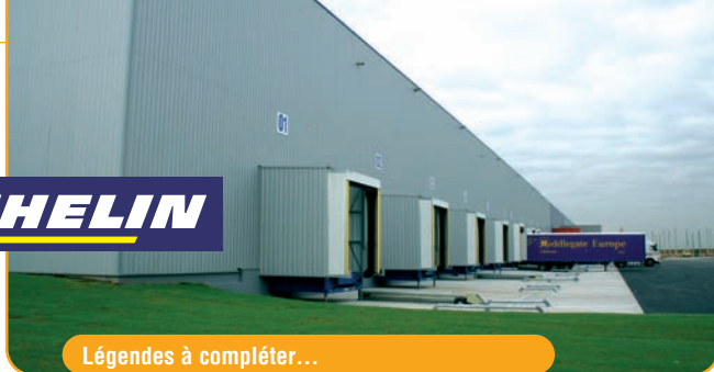
Légendes à compléter...

Eau Chaude d'une puissance unitaire de 50 kW. Plus de 2 000 mètres de canalisation ont été mis en œuvre pour permettre leurs raccordements. MOTIF a volontairement opté pour une chaufferie surpuissante afin de répondre à la prochaine extension du bâtiment. Pour les bureaux, MOTIF a préconisé l'installation d'un groupe de production réversible de 50 kW alimentant 16 unités terminales. Cette solution permet de bénéficier d'un confort permanent été comme hiver.