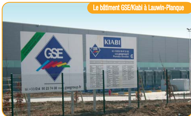
Le bâtiment GSE/Kiabi à Lauwin-Planque

La société Kiabi avait besoin depuis longtemps d'un très important centre de logistique, en volume et bien situé. Son choix s'est porté sur la ZA de Lauwin-Planque. Le projet consistait à construire un bâtiment de 66 000 m 2 comportant 11 cellules de 6 000 m 2 et plus de 2 000 m 2 de bureaux. Ce chantier qui ne présentait pas du point de vue de la construction de difficultés particulières, comportait toutefois des obligations liées à la réglementation thermique RT 2005, à savoir un renforcement de l'isolation.