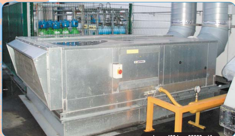
make-up 408 kw - 30000 m 3 /h

Enfin, le service après-vente de MOTIF assure l'ensemble des prestations d'entretien des équipements installés au travers d'un contrat annuel. L'assurance pour notre client, Benteler Automotive, de profiter pleinement de ses installations !