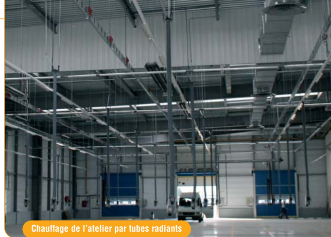
Chauffage de l'atelier par tubes radiants

En choisissant MOTIF, Gefco Benelux a privilégié la tranquillité d'esprit. L'offre globale MOTIF assure au client, réactivité, sérénité, sécurité et technicité. Ainsi, sur ce dernier aspect,