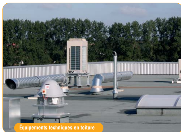
Équipements techniques en toiture