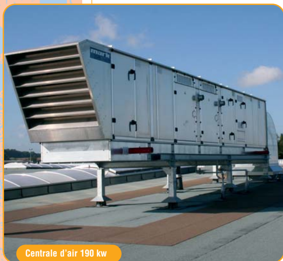
Centrale d'air 190 kw

Le chantier réalisé en Belgique nous a permis de tester notre capacité à nous adapter à de nouvelles réglementations et exigences client. L'esprit qualité et sécurité de nos équipes, leur professionnalisme, leur réactivité a permis de réussir ce nouveau challenge. Ainsi, MOTIF se fait un nom au-delà de nos frontières ! ■